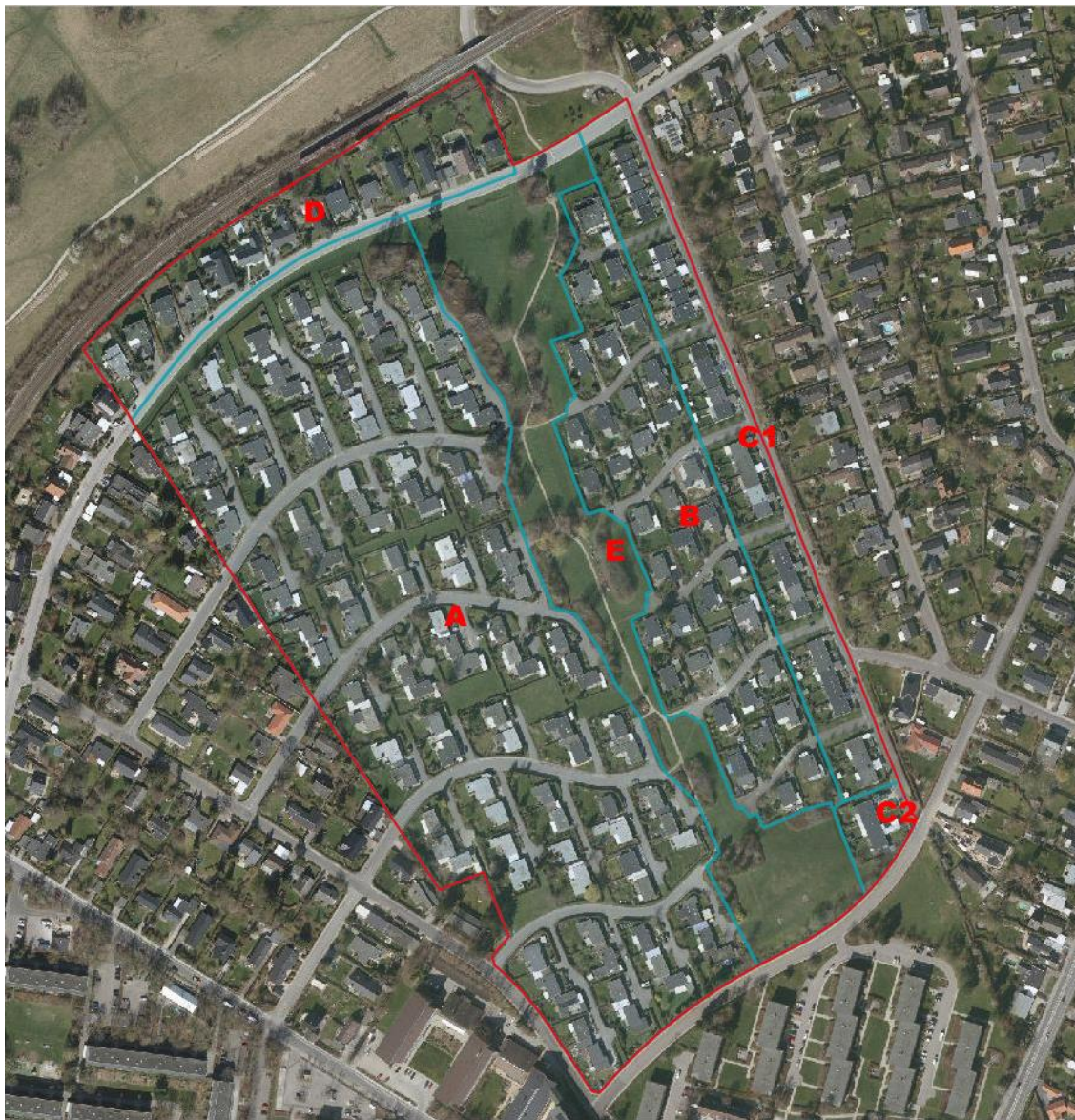
Bilag 1: ejendomme, som er omfattet af lokalplanen og inddeling af lokalplanen i delområder